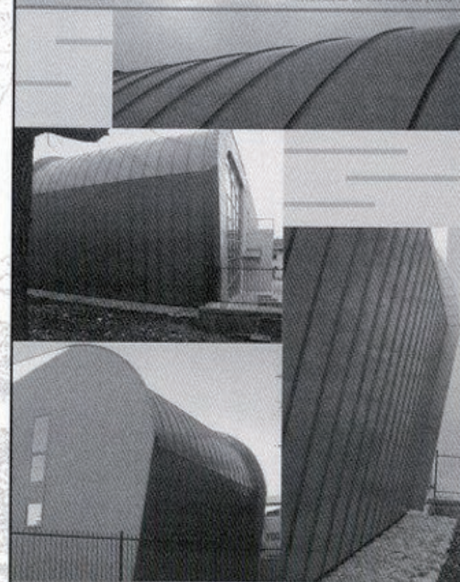
1° SEZIONE Realizzazione di una Ludoteca - Centro Civico Comune di Lanclano (CH) Adele Di Campi

La facciata in vetro stabilisce un collegamento diretto tra l'interno dell'edificio e la piazza prospiciente, quasi ne fosse il suo naturale prolungamento. La caratteristica riflettente la trasforma in uno "specchio della città e dell'interno" assorbendone, di volta in volta, i gesti della quotidianità e le intenzioni dei cambiamenti climatici.